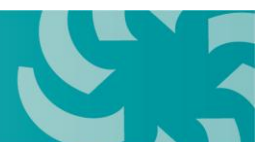
Tabel 2 Cross reference ISO 14064-1